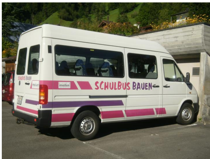
Foto: Aktueller Schulbus Bauen

Aus Sicht der Gemeinderäte von Bauen und Seedorf sowie des Kreisprimarschulrats besteht aufgrund der erwähnten Punkte Handlungsbedarf, das bestehende Fahrzeug durch einen neuen Schulbus zeitnah zu ersetzen. Für den Schülertransport ist man auf ein sicheres, funktionsfähiges und zuverlässiges Fahrzeug angewiesen. Mit dem aktuell im Einsatz stehenden Schulbus können diese Voraussetzungen längerfristig nicht mehr garantiert werden.