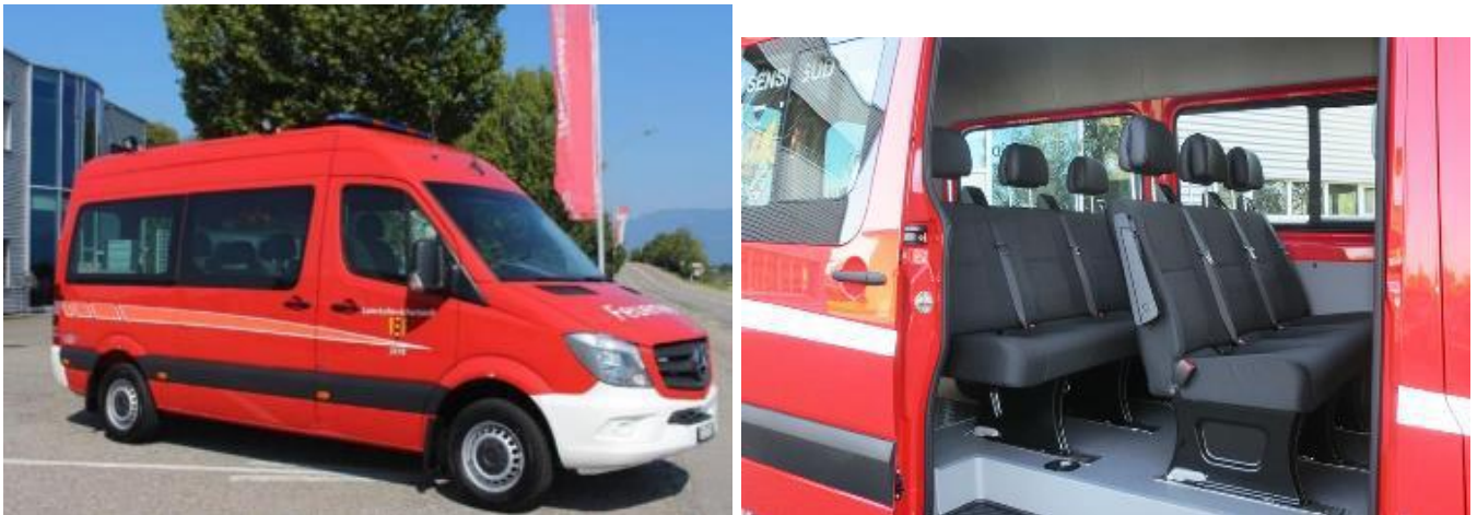
Fotos: Beispiel eines Mannschaftstransportfahrzeuges

Gestützt auf das Pflichtenheft hat man verschiedene Offerten bei Herstellern von Feuerwehrfahrzeugen eingeholt. Die Auswertung der eingegangenen Offerten erfolgt durch die Feuerwehrkommission, so dass anschliessend über die Vergabe, aufgrund eines technischen und wirtschaftlichen Vergleichs der Angebote, entschieden werden kann.